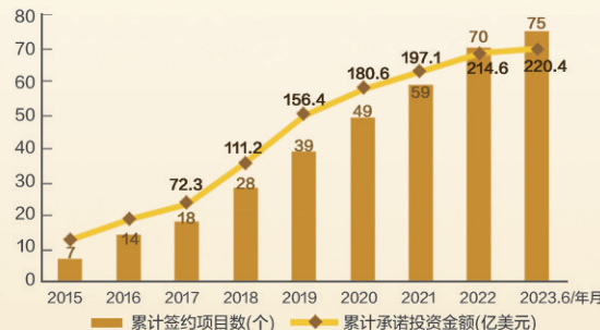
2015年以来丝路基金历年累计签约项目数和承诺投资金额

中国已与 20 个共建国家签署双边本币互换协议，在 17 个共建国家建立人民币清算安排。